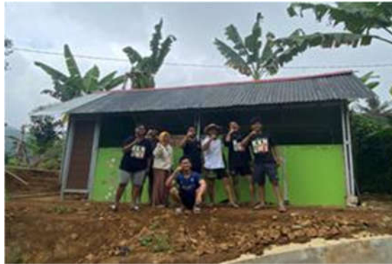
Gambar 7. Pelaksanaan pembangunan rumah produksi jamur tiram oleh Tim Fasilitator dan anggota Rukun sehati

pekerjaan pemasangan kuda-kuda, yang berfungsi sebagai rangka atap dan memberikan dukungan yang kuat. Selanjutnya, tim fasilitator akan memasang atap untuk melindungi struktur dari cuaca dan elemen luar, memastikan bahwa lingkungan di dalam rumah produksi tetap optimal untuk pertumbuhan jamur. Tahap terakhir dalam proses ini adalah pemasangan dinding dan pintu, yang tidak hanya berfungsi sebagai pelindung tetapi juga memberikan akses yang mudah ke dalam dan luar bangunan.