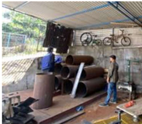
Gambar 8. Pengadaan bahan pembuatan steamer oleh tim fasilitator

Setelah menyelesaikan proses desain, tim fasilitator mengevaluasi kembali untuk memastikan bahwa semua aspek telah dirancang sesuai dengan kebutuhan dan tujuan dari pembuatan steamer tersebut. Apabila desain telah sesuai, tim fasilitator melakukan pengadaan alat dan bahan yang telah ditentukan sebelumnya. Proses ini melibatkan pemilihan berbagai bahan baku dan peralatan yang akan digunakan untuk pembuatan steamer baglog jamur tiram. Pada tahap pengadaan, tim fasilitator membeli material yang telah ditentukan sebelumnya, termasuk bahan utama seperti beton, pasangan bata, dan besi bekas yang dimodifikasi. Tim fasilitator juga memilih peralatan yang sesuai, seperti elemen pemanas, thermostat, pipa, dan komponen pengamanan lainnya.